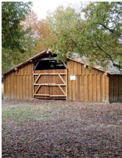
La bergerie des Matruques.

Après restauration, le site accueille désormais un troupeau de 500 moutons landais et chèvres des Pyrénées géré par le Conservatoire et mené toute l'année, par notre berger Jean-Michel. Ce troupeau participe à des actions d'écopastoralisme en forêt entre Médoc et Bassin d'Arcahon. Les animaux permettent l'entretien des sous-bois et le maintien des paysages de landes ouvertes, en plus de favoriser la diversification floristique. Le site n'est pas ouvert au public pour le confort des animaux mais la municipalité organise parfois des événements, laissant ainsi le public découvrir cet espace naturel.