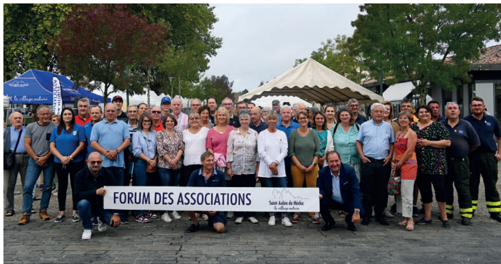
Forum des Associations 2023.