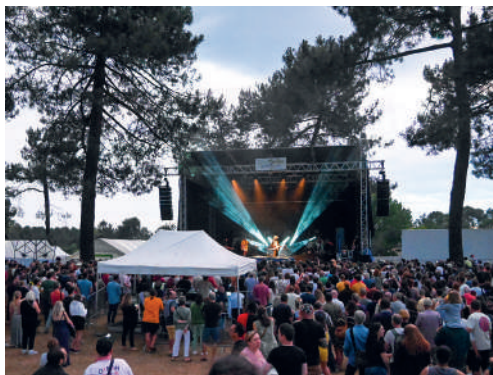
Festival des Noctambules 2023.